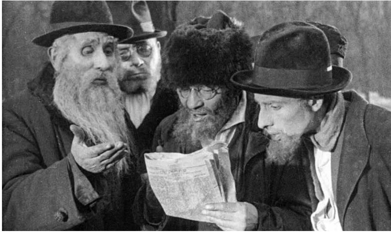
חרדים קוראים עיתון. תמונה מתוך הסרט האילם האוסטרי "העיר ללא יהודים" ( Die Stadt ohne Juden ) של הבמאי ה"ק ברסלאור מ־1924

כך, למרות הידיעות הקשות מאירופה אמר אחד הדוברים בוועידת אגודת הרבנים כי "האסון הגדול הביא לנו גם אור כי כוחותינו התעשרו בגדולים שבאו אלינו מאירופה. אנו כעת הקהילה היהודית הגדולה בעולם". 117 התחזקות האורתודוקסיה התבטאה בגידול במספר בתי הספר הדתיים, ובוועד החינוך כבר היו רשומים כ־110 בית ספר דתיים בניו יורק ומספר דומה של בתי ספר ב־55 ערים נוספות. 118 במקביל גדל מספר התלמידים בישיבת רי"א, שמספר הרבנים שהסמיכה כבר התקרב למאתיים, מהם שישים רק בשלוש השנים האחרונות. 119