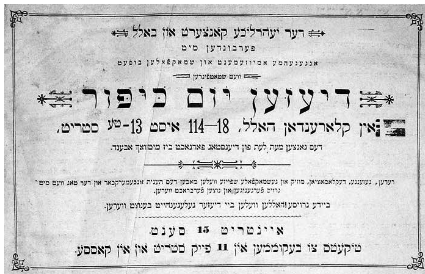
מודעה לנשף יום כיפור בניו יורק בסוף המאה התשע-עשרה

לאמריקה היו בעלי אמצעים. היות שרבים מהם באו מקהילות מסורתיות במרכז אירופה ומערבה, הם הקפידו על שמירת המצוות, לפחות בפרהסייה. לעומתם, המהגרים שבאו בתקופת ההגירה הגדולה ממזרח אירופה בסוף המאה התשע-עשרה נמנו עם שכבות כלכליות נמוכות והתקשו להמשיך לשמור על אורח חיים דתי. שבוע העבודה היה בן שישה ימים ובהם גם שבת; ושירותי הדת כמו חינוך יהודי, מקווה טהרה, מזון כשר או תשמישי קדושה שבמזרח אירופה היו זולים ונגישים, היו בארצות הברית יקרים וקשים להשגה. וכך, אף שרוב יהודי מזרח אירופה גדלו בבתים מסורתיים, קיבלו חינוך יהודי, שבתו מעבודתם בשבת, ביקרו בבית הכנסת כמה פעמים בשנה וצרכו מזון כשר, התנאים באמריקה גרמו לרבים מהם לזנוח את אורח החיים האורתודוקסי ולהצטרף לקהילות הרפורמיות והקונסרבטיביות.