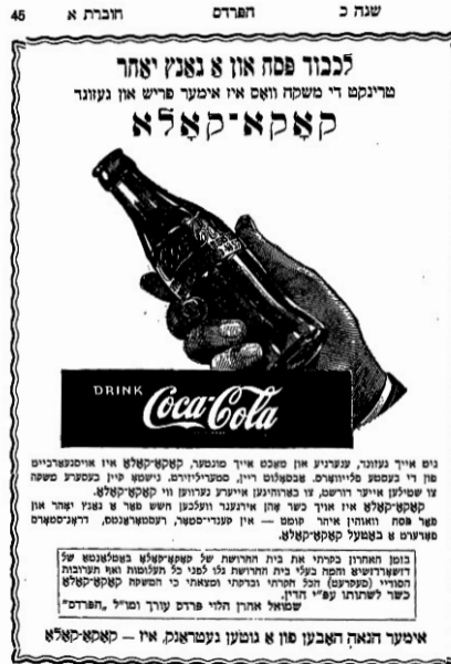
פרסומת לקוקה קולה בעיתון החרדי הפרדס, אפריל 1946

השיפור בחיי הדת באמריקה והחמרת מצבם של יהודי אירופה הביאו להגירתם של רבנים חשובים שלאחר השתקעותם השפיעו על עיצוב דמותה של האורתודוקסיה האמריקנית. נמנו עימם הרב יוסף דב בער סולובייצ'יק שמונה לרב בבוסטון והפך לדמות החשובה ביותר באורתודוקסיה המודרנית והרב יעקב יצחק רודרמן שהקים בבולטימור את ישיבת נר ישראל, אחת מהישיבות החשובות במדינה. 84 במקביל גדל קצב הכשרת הרבנים בישיבות האמריקניות ובמיוחד בישיבת רי"א, ועם הגידול במספר הבוגרים הם ייסדו ארגון משלהם שיחד עם אגודת הקהילות היהודיות האורתודוקסיות הקימו את הסתדרות הרבנים. 85 הגידול במספר הרבנים הביא גם לביקורת על מינויים לא ראויים: "ומה דרשו מהשמש הזה שכן[י]נוהו בשם רב או ראבי? דבר פשוט. להמשיך [למשוך] אנשים הרבה לביה"כ [בית הכנסת] או אל ההיכל למען תתרבה בה ההכנסה. לא להמשיך לבן של ישראל לאביהן שבשמים או להיהדות, רק להרבות ולהאדיר את הביזנעס, וכל האמצעים כשרים לזה". 86 חוסר האחידות ברמת הרבנים והיעדר ארגון מוסכם שיכריע בשאלות מהותיות יצרו מחלוקות רבות בקהילות ובוועדי הכשרות. 87 בעקבות עליית היטלר לשלטון ב-1933, גברו הפעולות האנטישמיות נגד יהודי גרמניה ובארצות הברית החלו היהודים בפעולות מחאה שנמשכו עד לשואה. 88 במקביל גברו הרדיפות של יהודי פולין שכללו גם הטלת מגבלות על השחיטה היהודית, והחלה מגבית למענם. 89 באותן שנים חל שינוי משמעותי באורתודוקסיה באמריקה, כאשר חסידות חב"ד החלה לפעול בה באופן מאורגן והפכה לכוח מוביל. 90 במקביל, כ-70,000