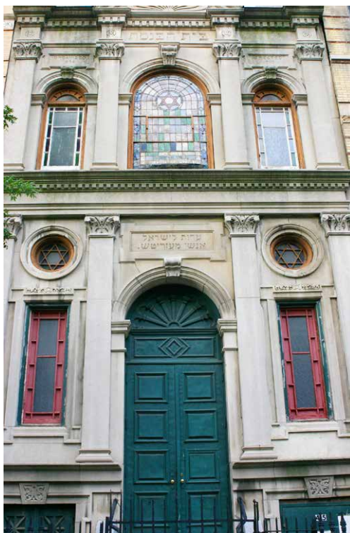
בית כנסת מזריטש בלואר איסט סייד

הראשונה של המאה העשרים לדומיננטי ביהדות האורתודוקסית ואחד מצעדיו הראשונים היה לפרסם חוברת תקנות. 7 למרות זאת דיווחה העיתונות האורתודוקסית כי "יהדותנו הקדו[ן]שה מורשת אבותינו [...] יורדת פלאים בארץ הזאת, הלוך ושקוע [...] מיום אל יום ומשנה אל שנה דת קדשנו נהרסת [...] עיני[ן]רות גדולות בישראל וקהילות קדושות שבראשית התושבים התנהגו ככל חוקי התורה הקדושה נתהפכו לרועץ, בנינו יצאונו בכל יום ואין מנחם [...] נשואי תערובת – עובדות חיות וקימות בכל יום". 8